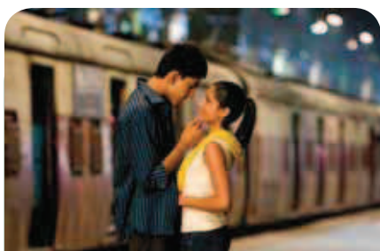
12. 3. 2014 MILIONÁŘ Z CHATRČE Hlavní hrdina, mladík Jamal Malik

A zdá se, že svatební oslavy, které probíhají v prosluněném dni v rodinném kruhu v sídle nevěstinych rodičů obklopeném romantickou krajinou, budou skutečně nejkrásnějším začátkem společného života. Ovšem... kdyby se na svatební hostině náhle neobjevil nezvaný host. Jan Benda si brzy získává náklonnost přítomných. Maminky i tetičky mu podstrojují, muži mu bodře nalévají. Kdo to však vůbec je? A odkud se vzal? Je to jen neškodný vetřelec, který se obvykle vmísí do davu s cílem zadarmo se najíst? Nebo se vynořil z minulosti někoho ze svatebčanů? A koho? S Janem Bendou u svatebního stolu dostává romantika trhliny. Toho chlápka je třeba dostat co nejrychleji pryč. Některá tajemství by prostě neměla být prozrazena! Česko/Slovensko, 2013, 98 min. Režie: Jan Hřebejk