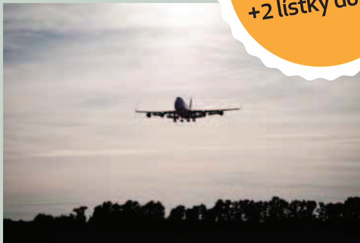
PŘÍSTÁNÍ BOEINGU 747-400 JUMBO NA LETIŠTI VÁCLAVA HAVLA.