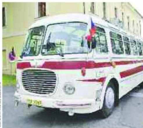
Autobus Škoda 706 RTO

nisterstvo kultury ČR. Národní památkový ústav zařadil objekt do památkového katalogu budov vhodných k zachování. Aktivitu vítá Středočeský kraj. Vážne to na majiteli objektu – Správě železniční dopravní cesty, která chce budovu zdemolovat. Co vy na to?